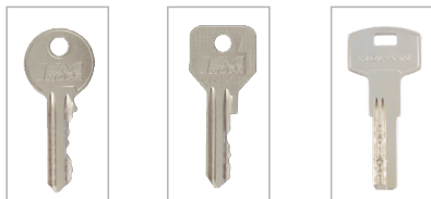
обычный «английский» ключ (AL Л, AL ЛВ)